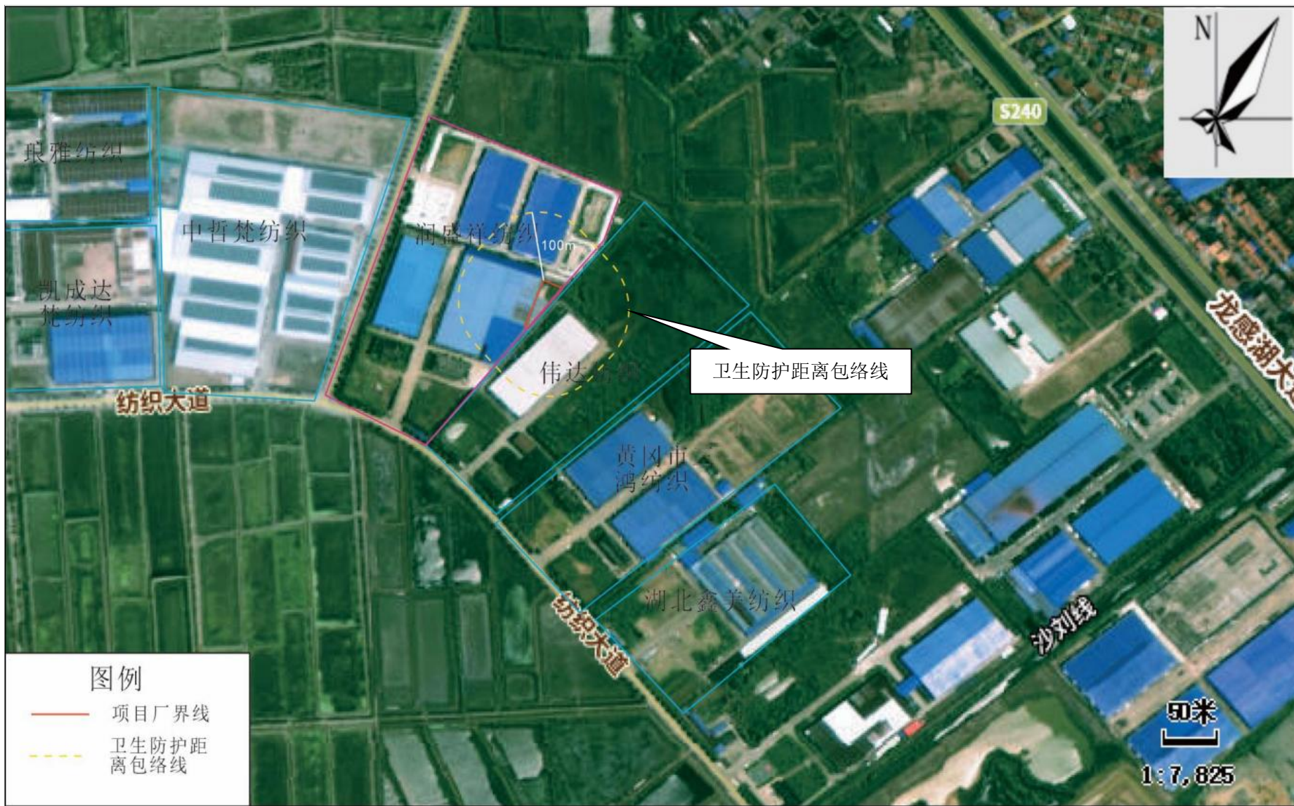
附图5 项目卫生防护距离包络线图