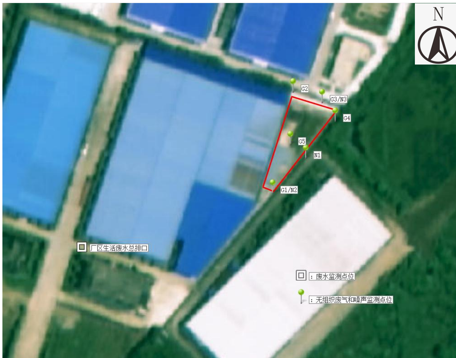
附图 4 项目监测点位图