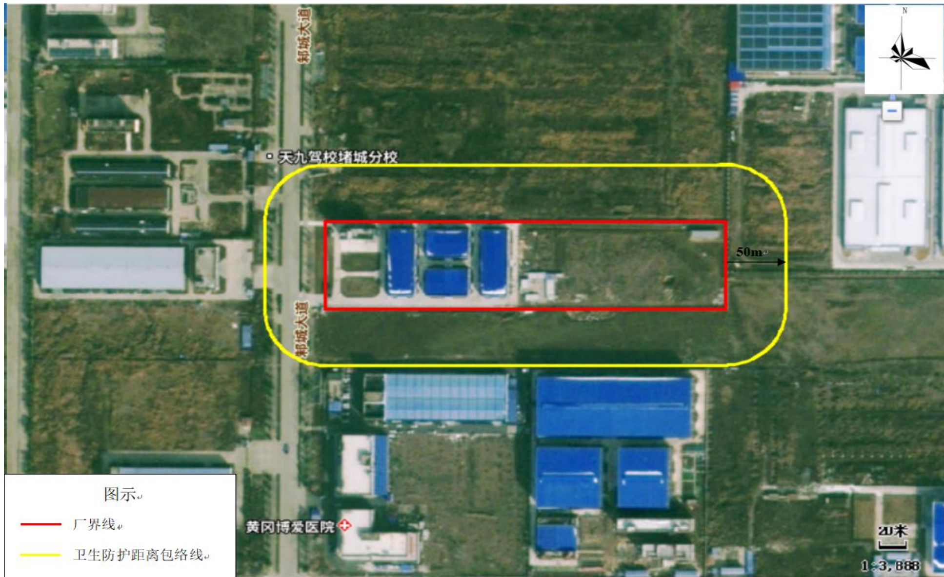
附图 6 项目卫生防护距离包络线图