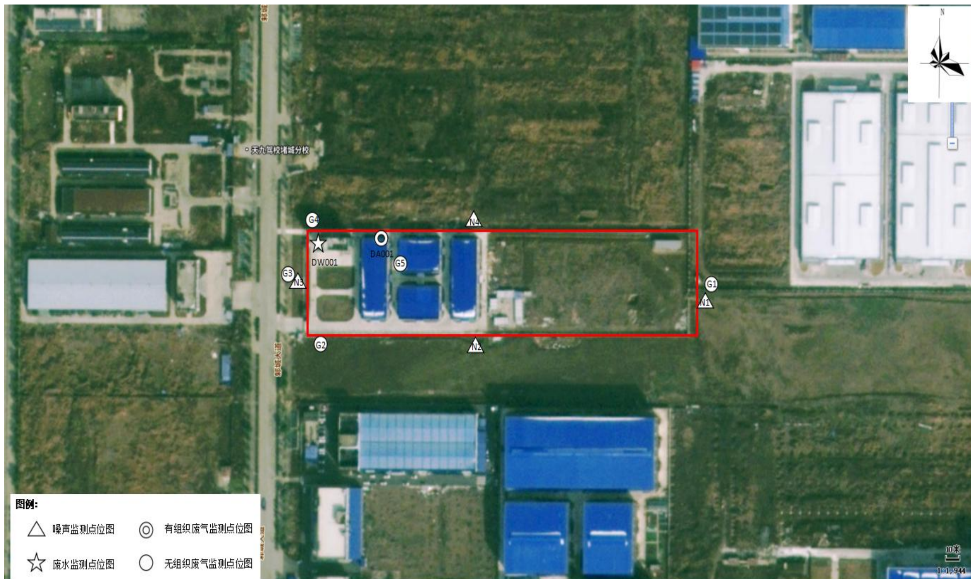
附图 5 项目验收监测点位图