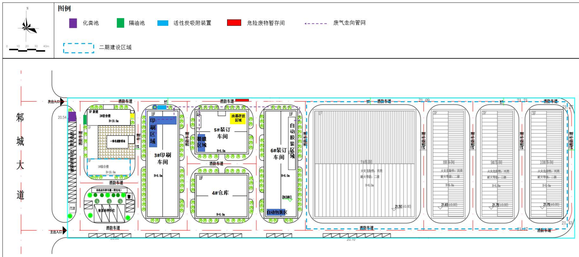
附图3 项目总平面布置图